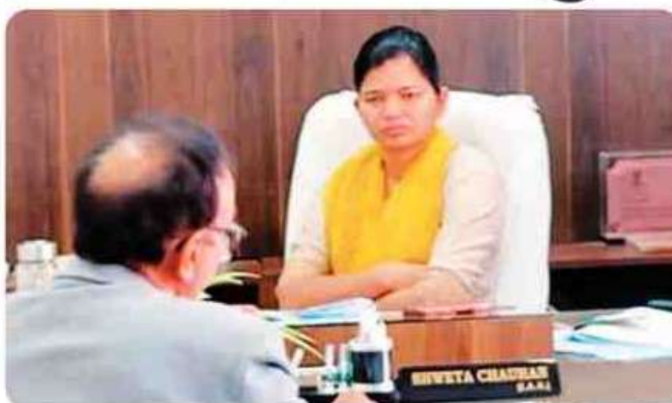
फलोदी. मतदाता सूची के प्रकाशन को लेकर कवायद हुई तेज। पत्रिका

शासन सचिव कुणाल ने कहा कि सभी निर्वाचन अधिकारी अपने-अपने जिलों में अंतिम प्रकाशन को लेकर पूर्ण तैयारी रखें। मतदाता सूचियों की प्रिंटिंग सहित सभी प्रक्रियाएं निर्धारित समयसीमा में पूरी की जाएं। संबंधित जिलों के कलक्टरों से प्रगति रिपोर्ट लेते हुए आवश्यक दिशा-निर्देश भी